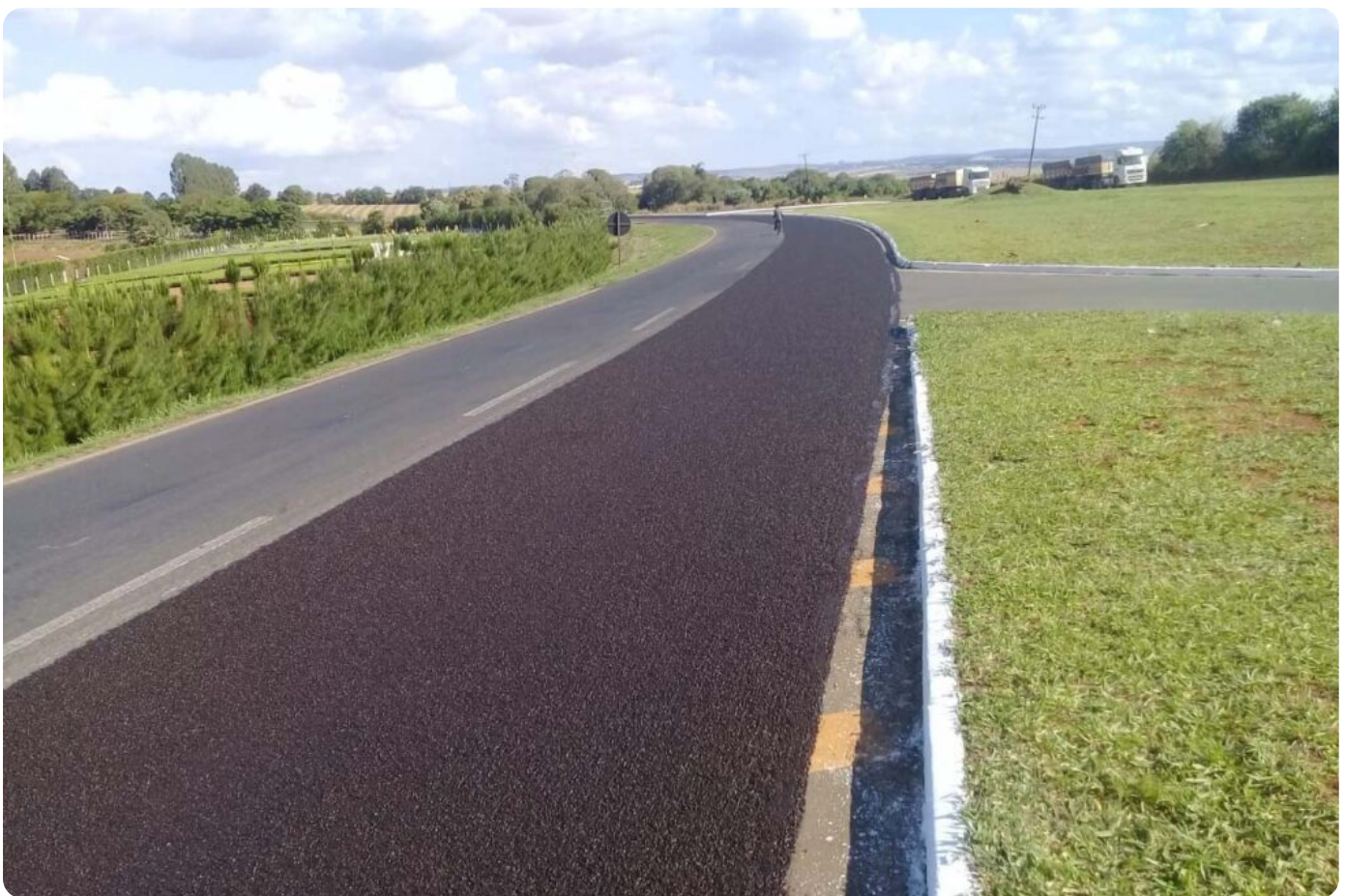
DER vai apresentar novos programas de conservação em audiência pública

O Departamento de Estradas de Rodagem do Paraná (DER/PR), autarquia da Secretaria de Infraestrutura e Logística (SEIL), realiza no dia 6 de setembro às 15h uma audiência pública para apresentar os seus novos programas de conservação da malha rodoviária estadual.