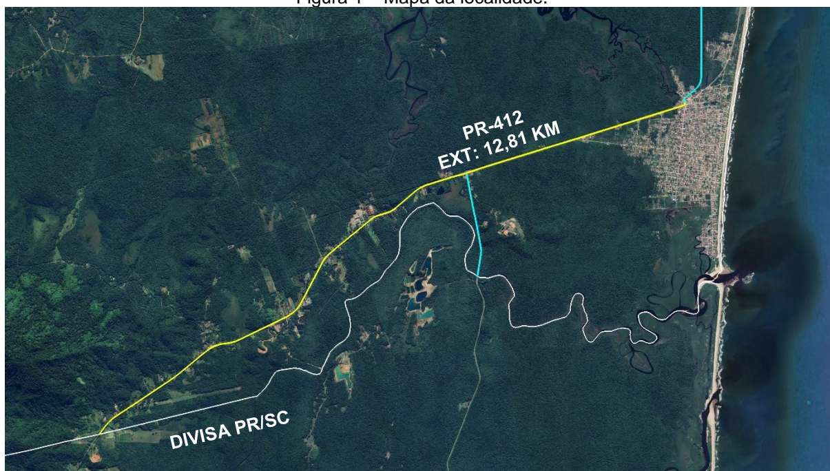
Figura 1 – Mapa da localidade.

3.7. A Figura 1 apresenta a localização das obras propostas a serem contratadas futuramente.