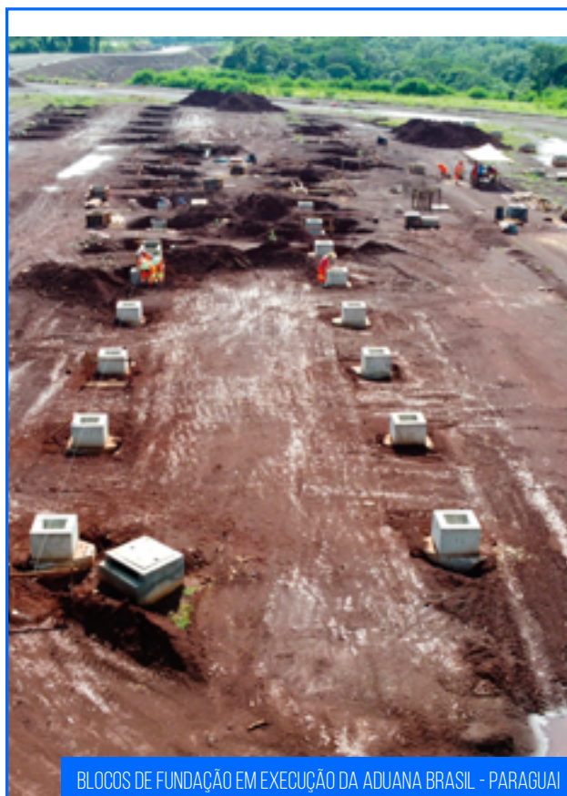
BLOCOS DE FUNDAÇÃO EM EXECUÇÃO DA ADUANA BRASIL - PARAGUAI

Quanto aos serviços de drenagem, essenciais para o funcionamento adequado das estruturas da rodovia, as equipes estão concentradas nos segmentos de terraplenagem e na intersecção com a BR-469, onde é necessária a execução da galeria dupla no cruzamento com a Av. das Cataratas. Após a galeria estar finalizada e em funcionamento, serão executadas as alças da intersecção.