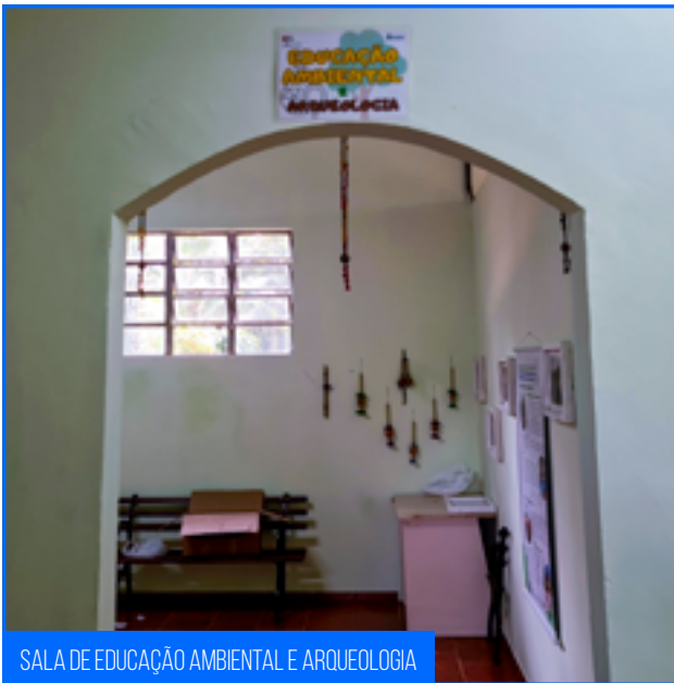
SALA DE EDUCAÇÃO AMBIENTAL E ARQUEOLOGIA