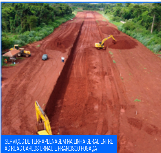
SERVIÇOS DE TERRAPLENAGEM NA LINHA GERAL ENTRE AS RUAS CARLOS URNAU E FRANCISCO FOGAÇA

As atividades de terraplenagem estão concentradas em cerca de 2 km compreendidos entre as ruas Carlos Urnau e Francisco Fogaça. Gerando a necessidade de interrupção da Rua Mata Verde, conforme anunciado nos meios de comunicação, para implantação da rodovia.