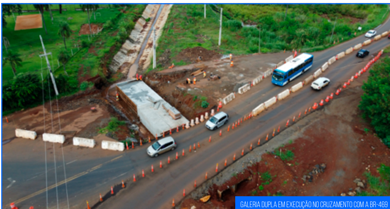
GALERIA DUPLA EM EXECUÇÃO NO CRUZAMENTO COM A BR-469

ATÉ O MOMENTO CERCA DE 22,6% DA OBRA FOI EXECUTADA, COM INVESTIMENTO DE APROXIMADO DE 30,95 MILHÕES DE REAIS.