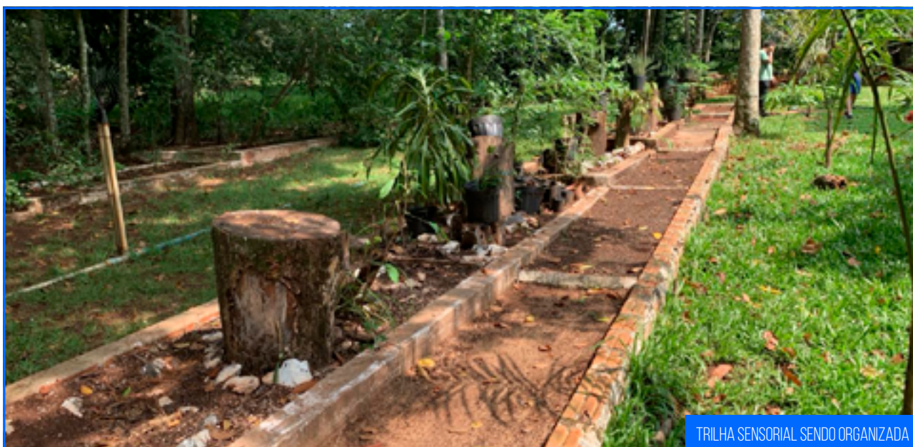
TRILHA SENSORIAL SENDO ORGANIZADA