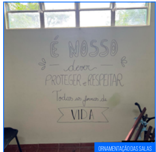
ORNAMENTAÇÃO DAS SALAS