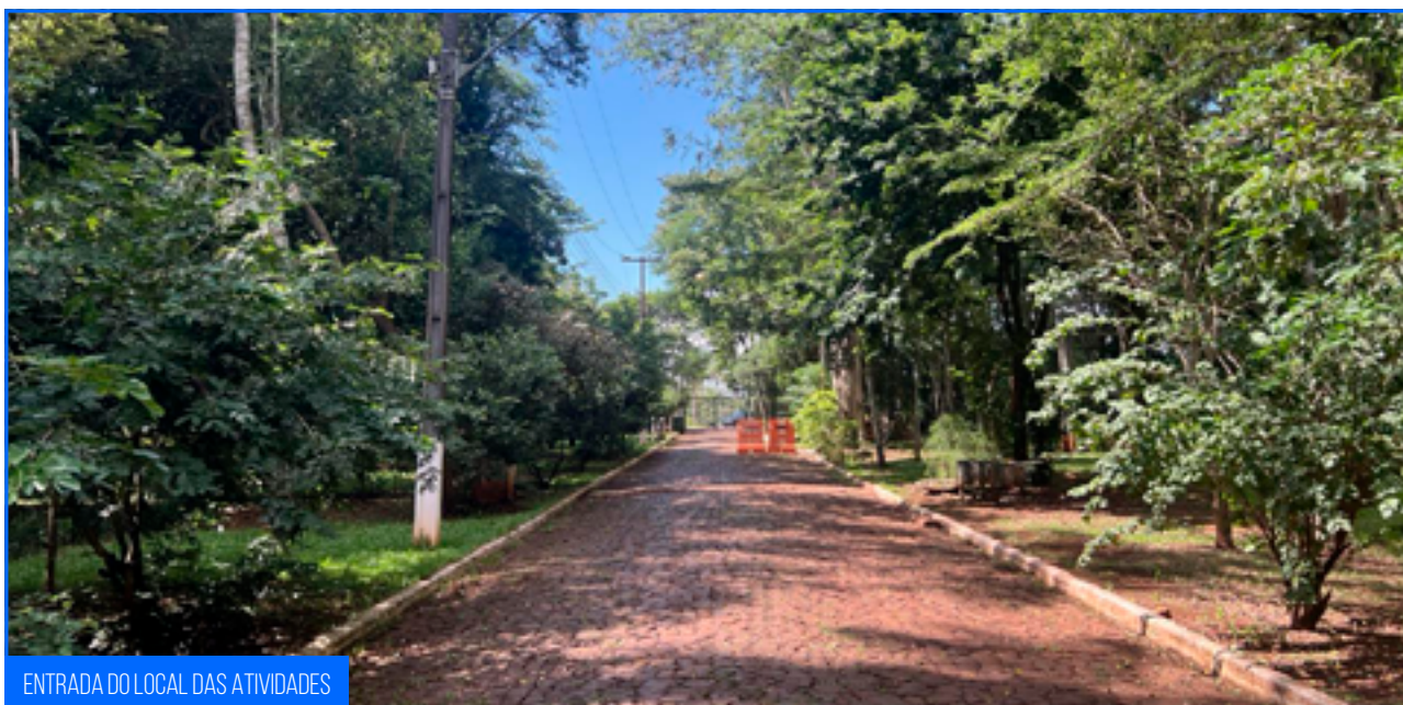
ENTRADA DO LOCAL DAS ATIVIDADES

Para um maior contato com a natureza, os visitantes podem vivenciar a experiência da trilha sensorial, na qual realizam um percurso em meio à vegetação local com o objetivo de estimular os cinco sentidos, através de obstáculos sensoriais, plantas medicinais e ornamentais, árvores nativas, placas coloridas e referenciadas, entre outros componentes.