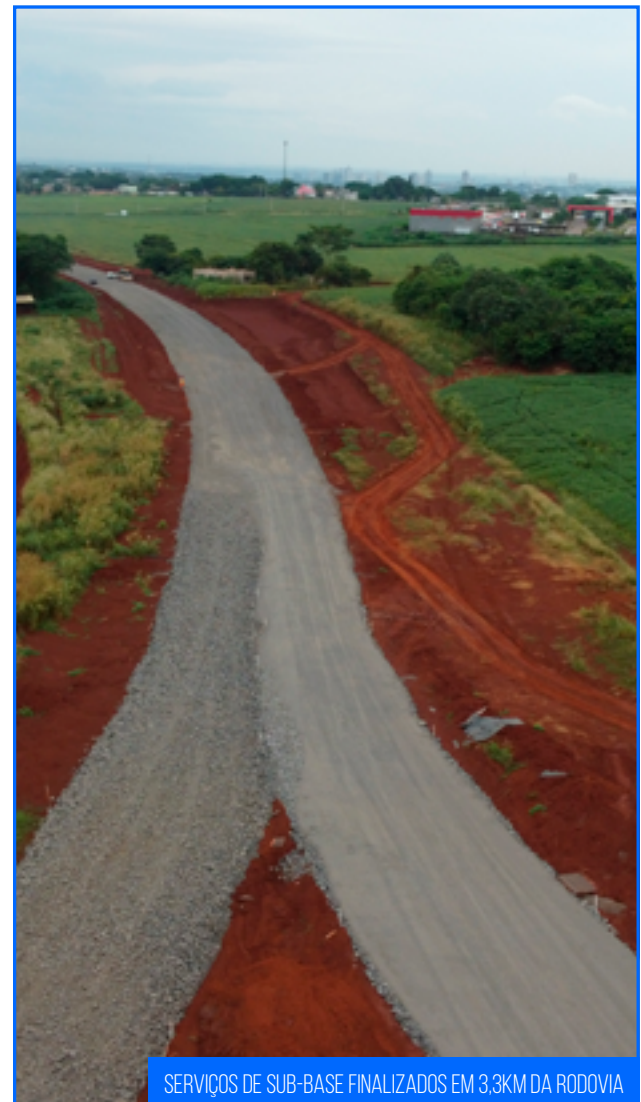
SERVIÇOS DE SUB-BASE FINALIZADOS EM 3,3KM DA RODOVIA

Os serviços de execução da camada de sub-base seguem em andamento nas áreas próximas aos presídios, onde está prevista a execução de uma rótula alongada a fim de possibilitar o acesso à rodovia de maneira segura.