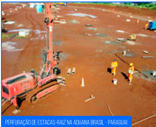
PERFURAÇÃO DE ESTACAS-RAIZ NA ADUANA BRASIL - PARAGUAI

Na aduana Brasil – Paraguai foram executados 23 blocos dos 100 que compõe a fundação da cobertura geral. Além de 220 estacas-raiz, faltando 80 unidades para finalizar esta etapa. Com as fundações finalizadas é possível dar início às obras civis.