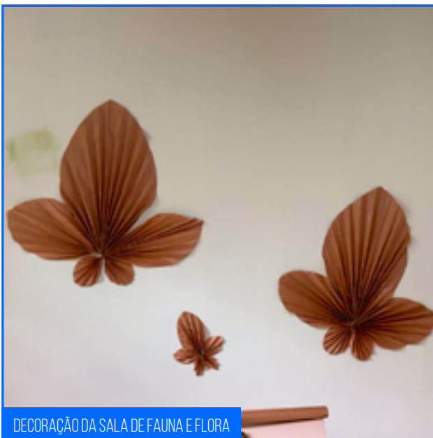
DECORAÇÃO DA SALA DE FAUNA E FLORA