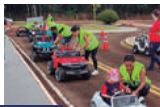
EPET - Cascavel