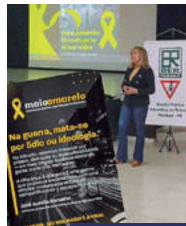
EPET - Maringá