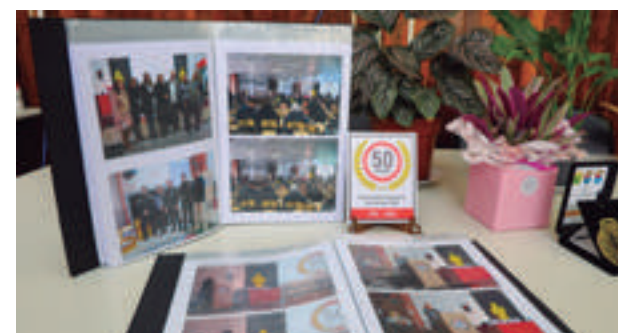
Um marco de 50 anos! Álbum da história dos pioneiros na educação de trânsito, reafirmando o compromisso com um futuro mais consciente e seguro.