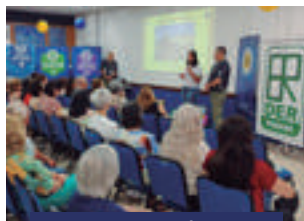
EPET - Londrina