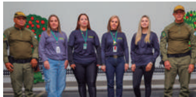
A equipe que faz a diferença na educação para o trânsito! Professores e Agentes da EPET - Curitiba, dedicados a ensinar os princípios básicos para que as crianças aprendam a se portar no trânsito, construindo um futuro mais seguro.