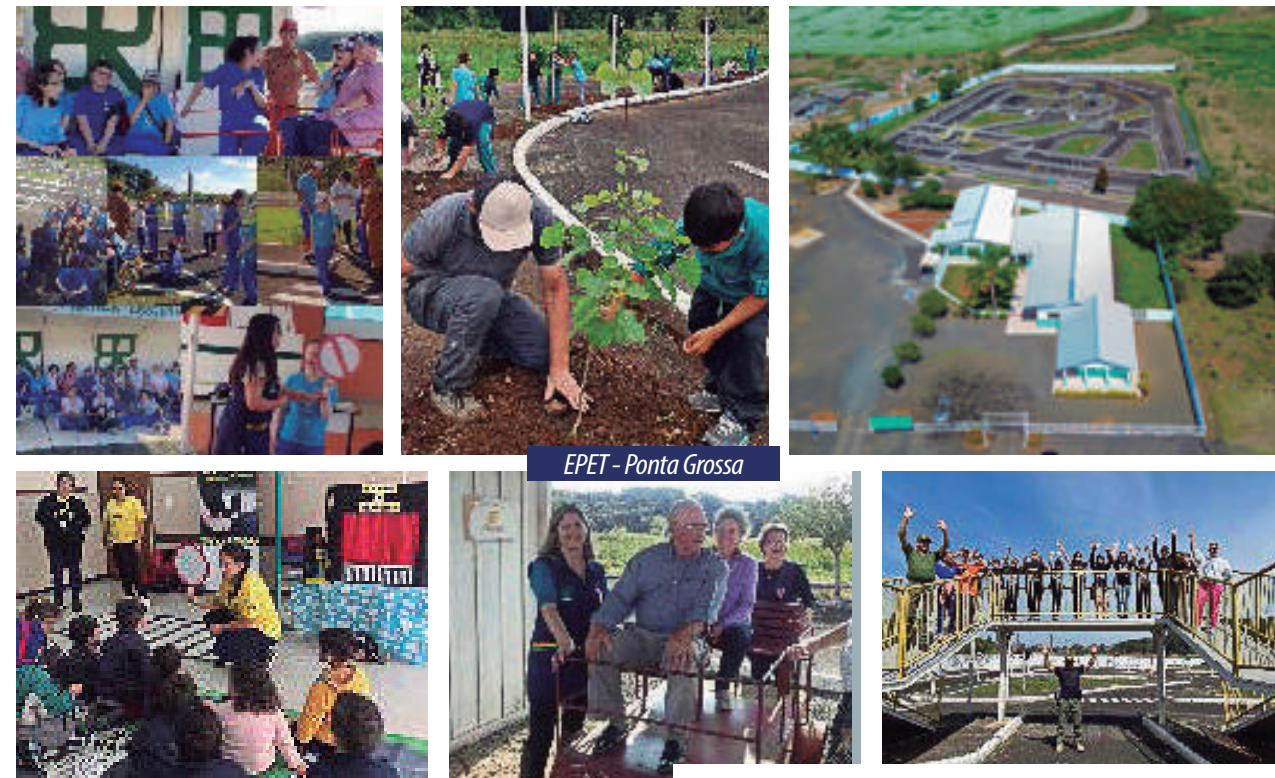
EPET - Ponta Grossa