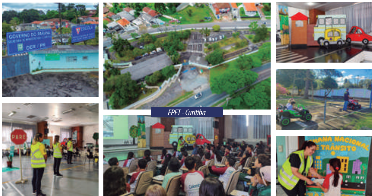
EPET - Curitiba